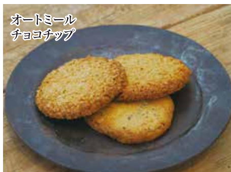
オートミール チョコチップ