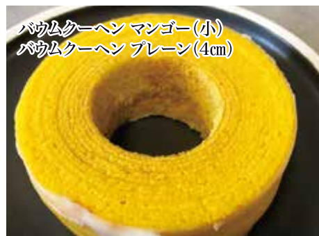
バウムクーヘン マンゴー(小) バウムクーヘン プレーン(4cm)