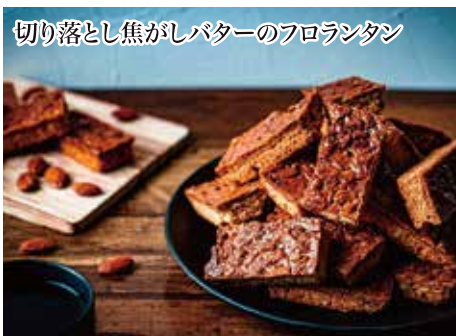
切り落とし焦がしバターのフロランタン