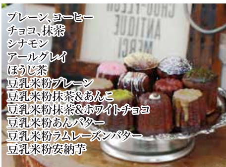
プレーン、ヨーヒー チョコ、抹茶 シナモン アールグレイ ほうじ茶 豆乳米粉プレーン 豆乳米粉抹茶&あんこ 豆乳米粉抹茶&ホワイトチョコ 豆乳米粉あんバター 豆乳米粉ラムレーズンバター 豆乳米粉安納芋