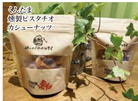
くんたま 燻製ピスタチオ カシューナッツ