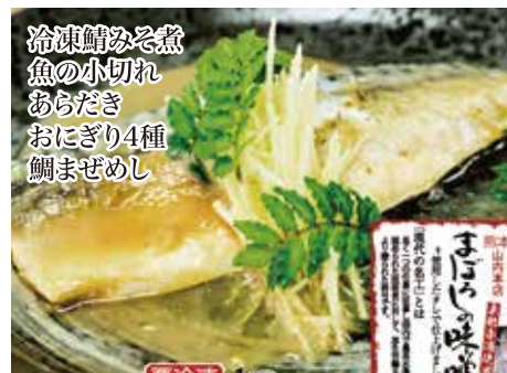
冷凍鯖みそ煮 魚の小切れ あらだき おにぎり4種 鯛まぜめし