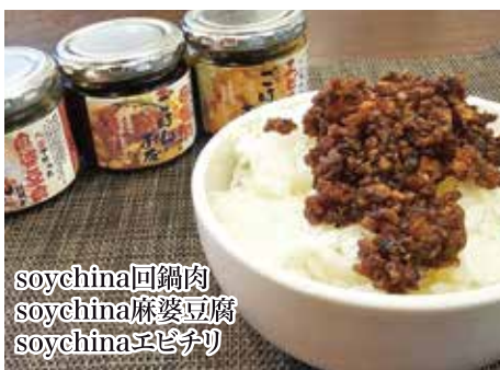
soychina回鍋肉 soychina麻婆豆腐 soychinaエビチリ